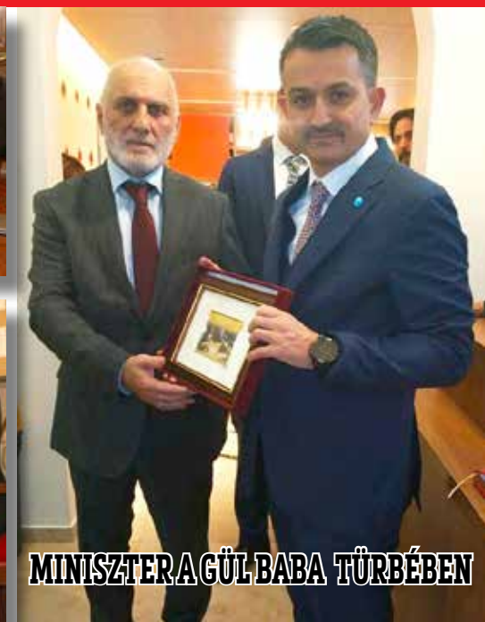
MINISZTER A GÜL BABA TÜRBÉBEN