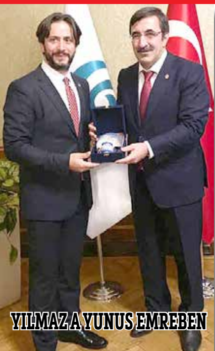
YILMAZ A YUNUS EMREBEN