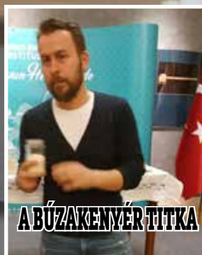
A BÚZAKENYÉR TITKA