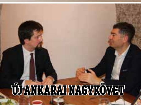
ÚJ ANKARAI NAGYKÖVET