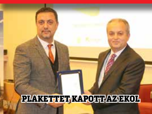
PLAKETTET KAPOTT AZ EKOL