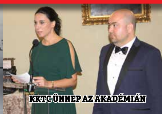
KKTC ÜNNEP AZ AKADÉMIÁN