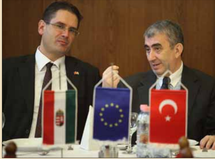
Sayın Büyükelçimiz Hasan Kemal Gür, Türk-Macar Parlamentolar Arası Dostluk Grubu Eşbaşkanı Tamás Hegedüs ile görülüyor

Büyükelçi Hasan Kemal Gür, binlerce yıldan bu yana devam eden Türk-Macar kardeşliğinin, Macaristan'ın 2011 yılı ile başlayacak olan AB Dönem Başkanlığı döneminde daha da güçlendirilmesine çalış-