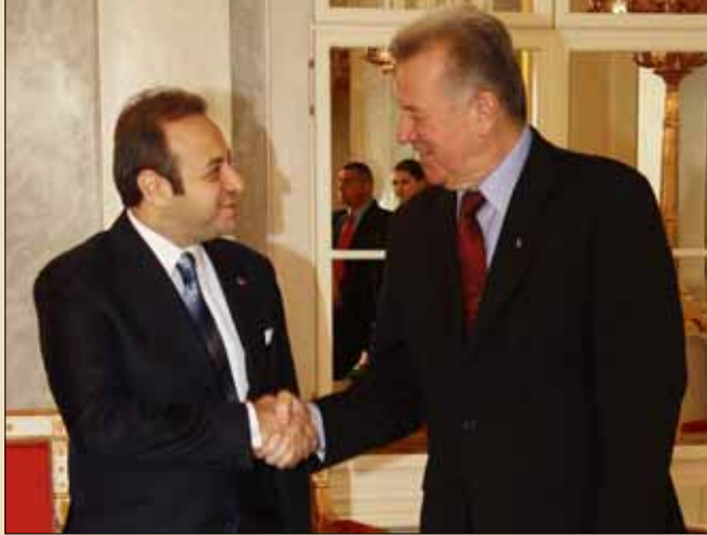
Başmüzakereci Devlet Bakanı Egemen Bağış, Macaristan Cumhurbaşkanı Pál Schmitt ile görüşüyor

"Biz kendimizi Avrupa'da en yakın hissettiğimiz milletlerden biri olan Macar halkının AB Dönem Başkanlığı'nı üstlendiği bir süreçte Türkiye'nin