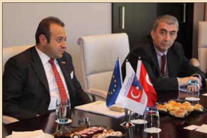
Hasan Kemal Gür nagykövettel közös sajtótájékoztatót választották meg az újságírók kérdéseit

Magyarország egyértelműen és határozottan támogatja Törökország csatlakozását az Európai Unióhoz és soros uniós elnökként is mindent meg fog tenni a török csatlakozási folyamatának előrelendítéséért - mondta Budapesten Martonyi János külügyminiszter, miután Egemen Bagış török államminiszterrel tárgyalt.