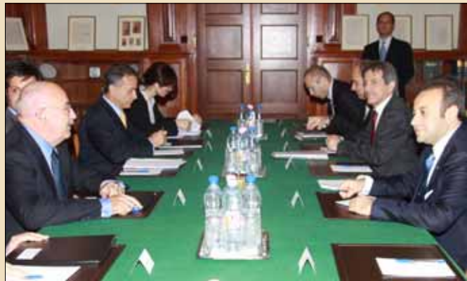
Elutazása előtt Martonyi János külügyminiszterrel tárgyalt, ahol érintették többek közt a vízumkönnyítéseket is.