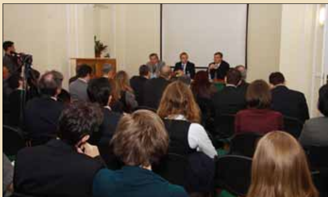
Egemen Bagış előadást tartott a Magyar Külügyi Intézetben országa EU csatlakozási szándékával kapcsolatban

Martonyi János kifejezte elismerését a török alkotmánymódosítással, illetve azzal kapcsolatban, hogy azt a népszavazáson a török nép csaknem hatvan százaléka támogatta. Az alkotmánymódosítást jelentős, az európai demokrácia irányába tett lépésnek tartják - fűzte hozzá. Egemen Bagış közölte, hogy jövő áprilisban Schmitt Pál köztársasági elnököt törökországi látogatásra várják.