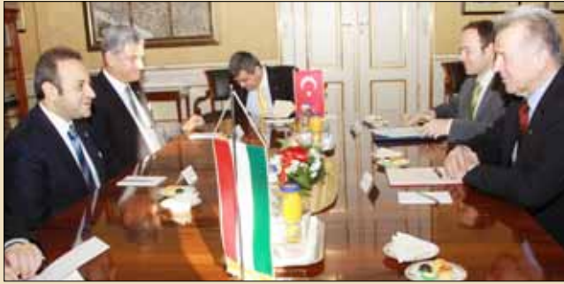
Başmüzakereci Devlet Bakanı Egemen Bağış, Macaristan Cumhurbaşkanlığı Sarayı'nda Macar Cumhurbaşkanı Pál Schmitt ile ikili görüşme yaparken

AB müzakerelerinde çok önemli gelişme yaşanacağına inanıyoruz".