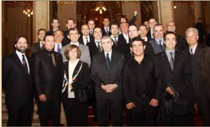
Türk-Macar sanayi ve Ticaret Odası'nın parlamentoda verdiği yemeğe katılan Türk ve Macar davetliler Sayın Büyükelçimiz Gür ile hatıra fotoğrafı çektiler

mak için ortak projelerin üretilmesi gerektiğinin altını çizdi.